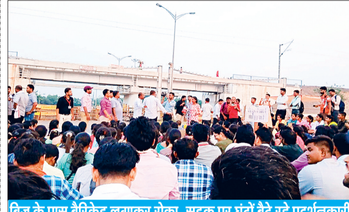
ब्रिज के पास बैरिकेड लगाकर रोका, सड़क पर घंटों बैठे रहे प्रदर्शनकारी

छत्तीसगढ़ प्रशिक्षित डीएड-बीएड कर्मचारी संघ के आवाहन पर डीएड-बीएड प्रशिक्षित अभ्यर्थियों ने तृता स्थित धरनास्थल से नेशनल हाईवे पर चक्का जाम करने रैली निकाली। प्रदर्शनकारियों को पुलिस ने अंडरब्रिज के पास रोक दिया। लामबंद अभ्यर्थी प्रदेशभर में रिकत 33 हजार शिक्षकों के पदों पर जल्द भर्ती की मांग को लेकर चक्का जाम करने निकले। भुक्तभोगियों का कहना है, रैली निकालने के बाद धरनास्थल की लाइट बंद करा दी गई।