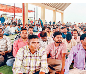
इटा पढ़ी आपरेटर्स ने दिया धरना, 2 सूत्रीय मांग

कहना है, द्दीपावली त्योहार से पूर्व उनके लंबित वेतन का भुगतान किया जाए। साथ ही 27 फीसदी वेतन वृद्धि का लाभ प्रदान किया जाए। मांग पूरी नहीं होने पर डाटा एंटी आपरेटर 21 अक्टूबर को मुख्यमंत्री निवास का घेराव करेंगे। वहीं 22 तारीख को वित्तमंत्री निवास घेराव करने का कार्यक्रम रखा गया है।